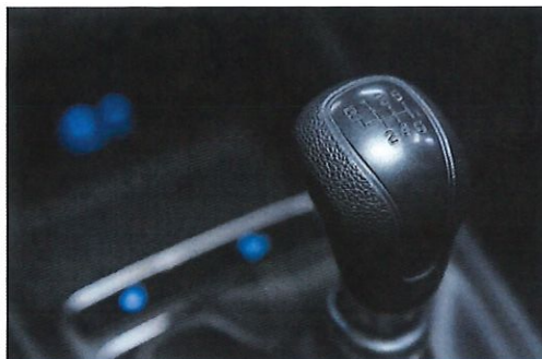
Figura 3: Transmisión manual de 6 marchas