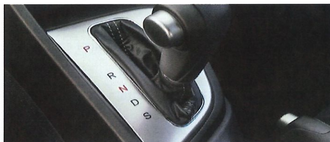
Figura 4: Transmisión automática