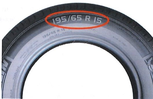
Figura 2: Ejemplos de datos que deben ser visibles en la fotografía del neumático